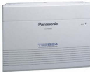
CENTRAL TELEFÓNICA 8 TRONCALES Y 24 EXTENCIONES KX-TES824