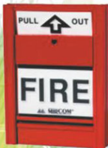
MS-400AD SERIES MANUAL ANALÓGICO