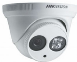
DS-2CE56C2T-IT1-IT3 Cámara turbo HD tupo domo