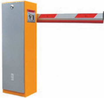
Barrar de estacionamientos