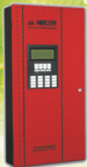
FA-300 SERIES PANEL DE INCENDIOS INTELIGENTE HÍBRIDO