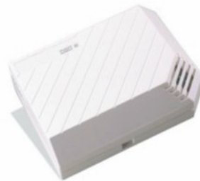
AC-101 DETECTOR DE ROPTURA DE VIDRIO ROBO