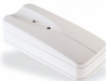
WLS912L-433 Detector de roptura de vidrio inalámbrico