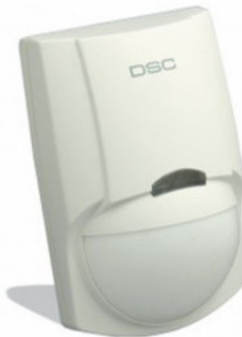
LC-100-PI DETECTOR DE MOVIMIENTO ANTI MASCOTA