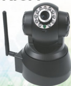
CÁMARA IP INALÁMBRICA WIFI