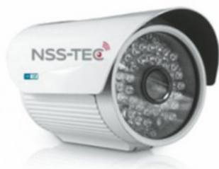
Cámara IP HD DE 2 Megapíxeles tipo cuerpo IP66 antibandalica infraroja