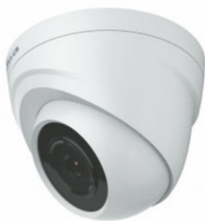
Cámara analógica de alta definición 720 P tipo domo HAC-HDW1100RN-0360B