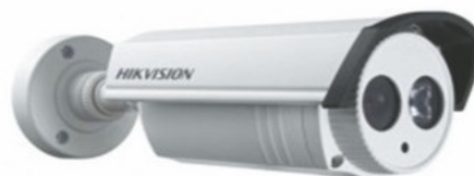
DS-2CE16C2T-IT1-IT3 Cámara turbo HD tipo bullet