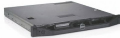
PowerEdge R220 rack server