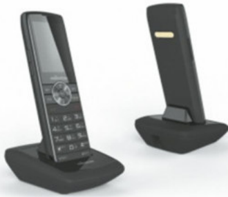
MST-MWP1100A wifi phone