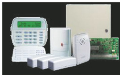
Sistema de alarma de robo DSC