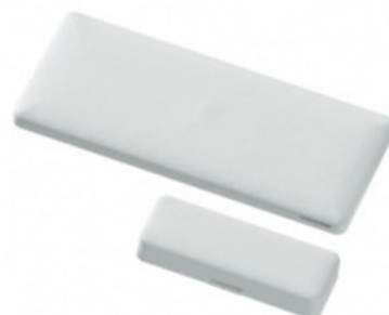
PG9975 Contacto magnético inalámbrico