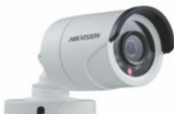
DS-2CE16C2T-IR Cámara tipo bullet turbo HD