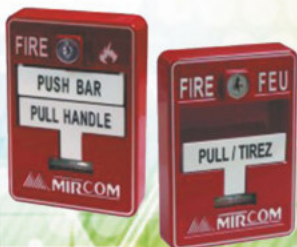
MS-700AD MANUAL DIRECCIONABLE INTELIGENTE