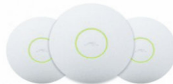
UAP, UAP-LR, UAP-PRO