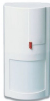
WS4904 DETECTOR INFRARROJO PASIVO INALAMBRICO