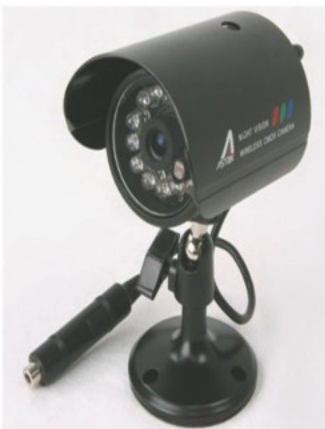
ASTAK - SET CÁMARA DE SEGURIDAD INALAMBRICA