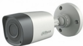
Cámara tipo bullet HD DH-HAC-HFW1100R