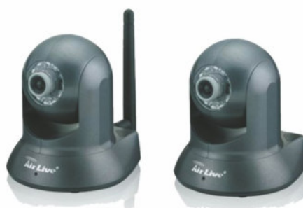
MINI CAMARA INALAMBRICA