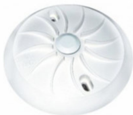
TD SERIES DETECTOR CALOR