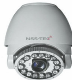
PTZ IP HD DE 2 Megapíxeles día noche NS-C7HA1080IL-T18