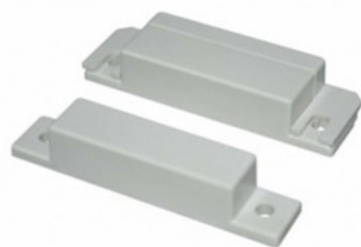
PG9975 Contacto magnético