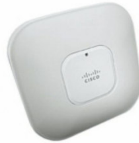
CISCO AIRONET 1140