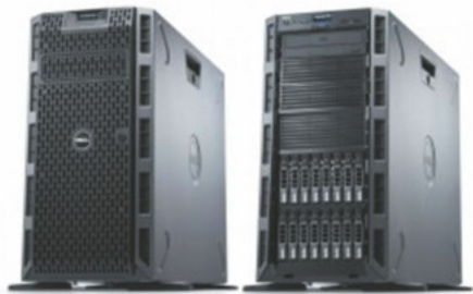
PowerEdge T320 Tower Serve