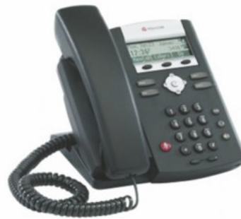
Polycom IP 335