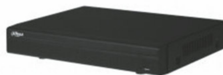
DVR Tribrido (HD-CVI - IP - análogo) HCVR510451085116H-S2