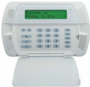
SCW9047 TECLADO ALFANUMÉRICO INALÁMBRICO