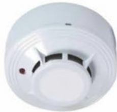
DETECTOR DE HUMO PHOTOELECTRIC