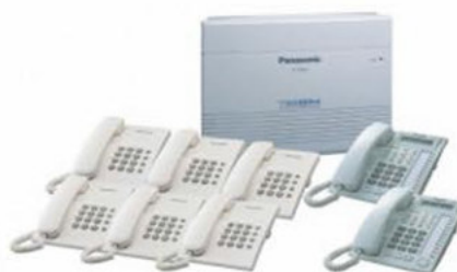
KITS DE CENTRAL PANASONIC ANALOGA KX-TEM824