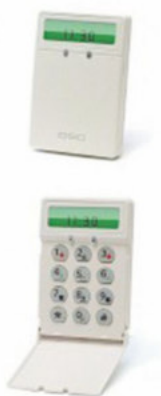
CD5511 teclado alfanumérico