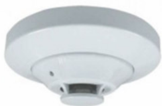
MIX-5251 DETECTOR DE HUMOS DIRECCIONABLE INTELIGENTE